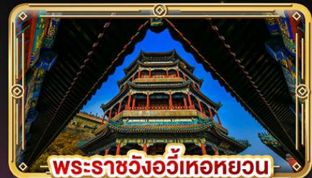
พระราชวังอู่เหอหยวน